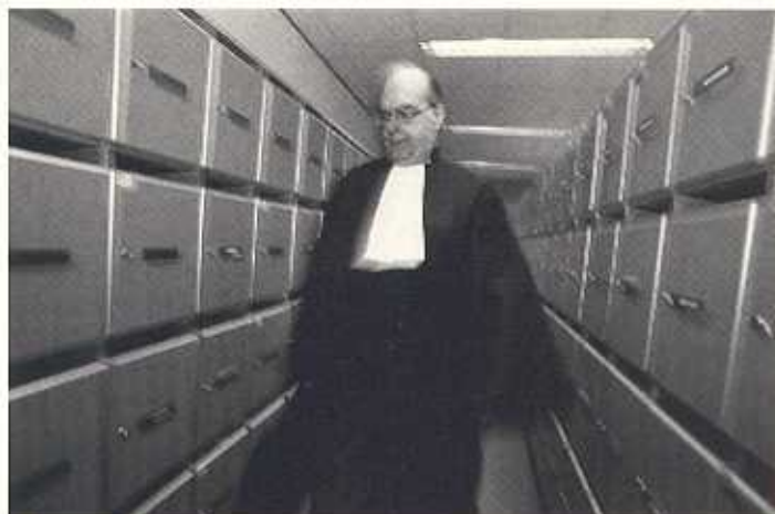
Advocaat in toga en bef loopt in de advocatenkamer tussen de togakastjes door.