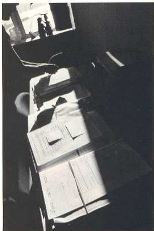
Links: Een rechter neemt dossiers door op haar kamer in de rechtbank van Rotterdam.